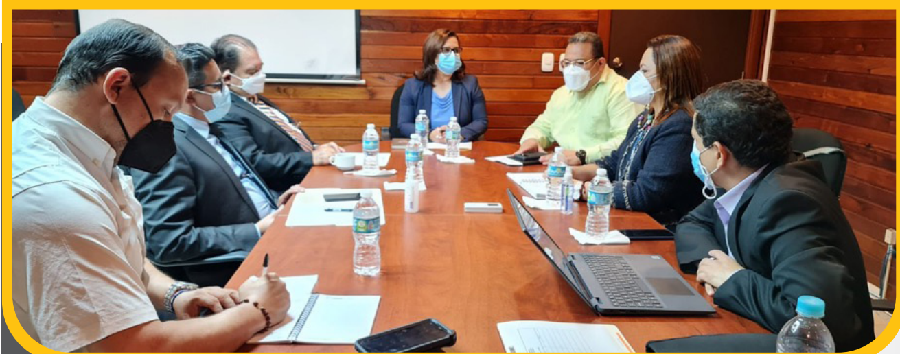
Visita de representantes de FONAC.