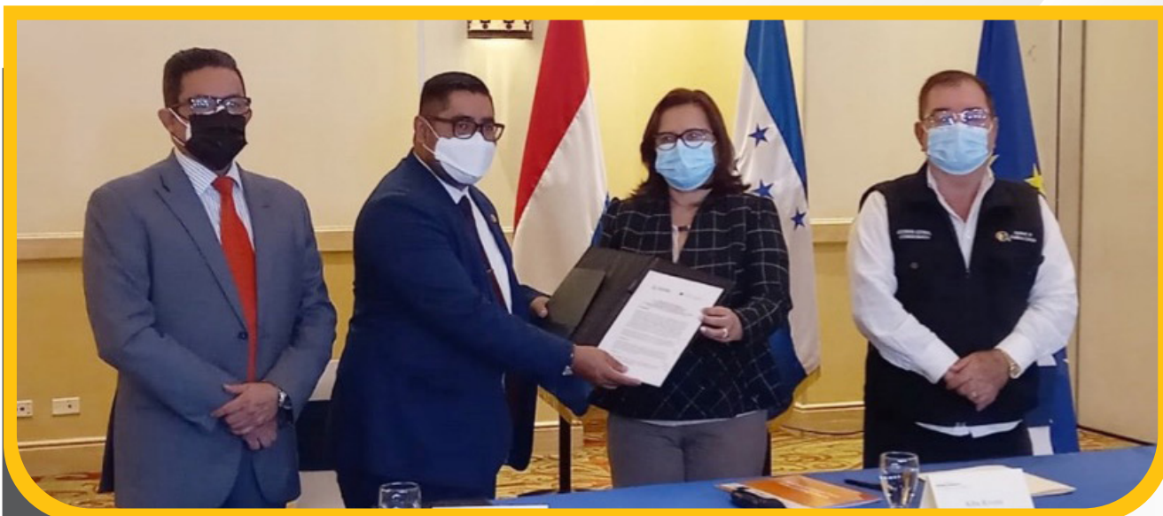
Firma de Memorando de Entendimiento con el NIMD