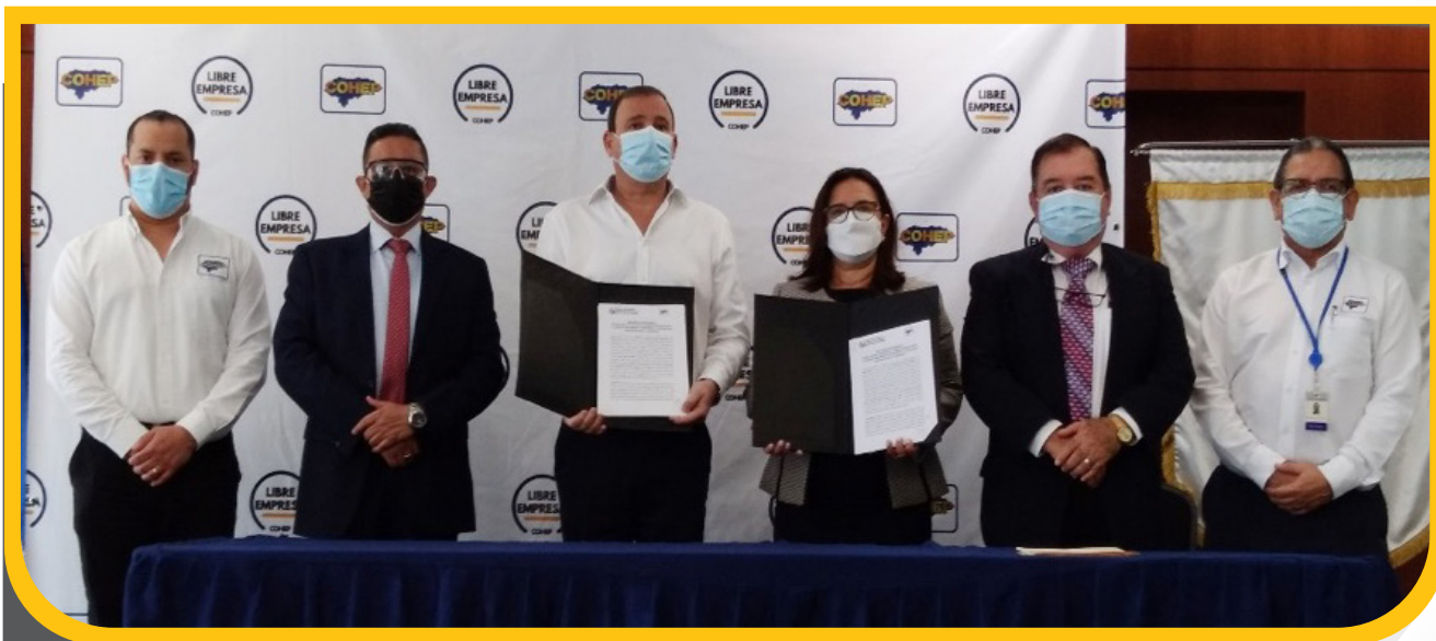
Firma de Memorando de Entendimiento con el COHEP