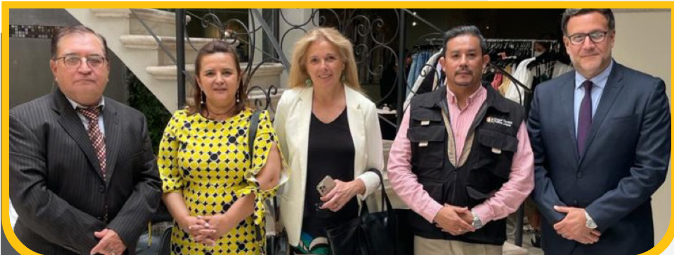
Reunión con Representantes de IFES.