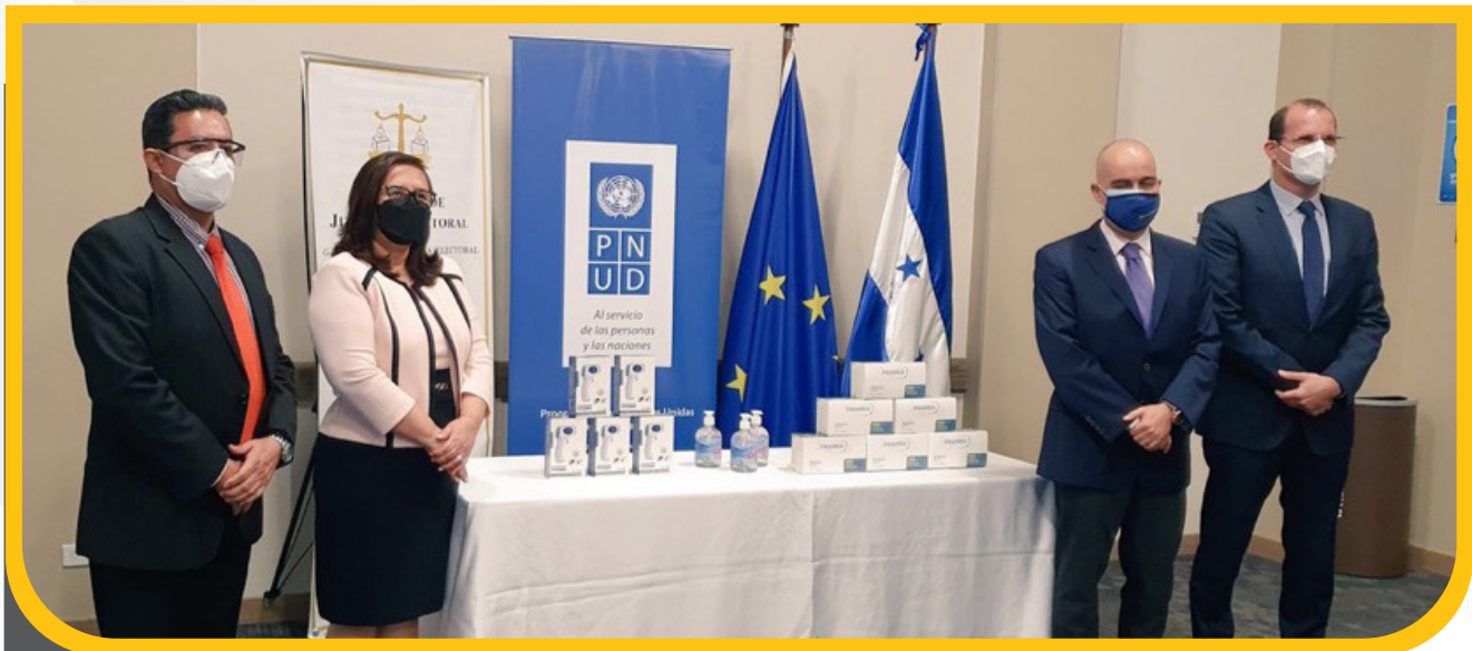
Donación de insumos de bioseguridad por parte de PNUD.