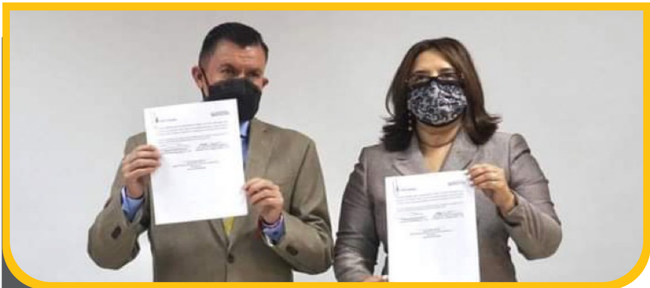
Firma de Carta de Entendimiento con el IAIP